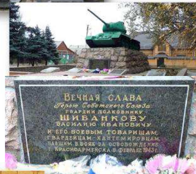
Братская могила, в которой похоронен В.И. Шибанков. Город Красноармейск (Покровск) Донецкой области.

ВЕЧНАЯ СЛАВА Герою Советского Союза ГВАРДИИ ПОЛКОВНИКУ ШИБАНКОВУ ВАСИЛИЮ ИВАНОВИЧУ И ЕГО ВОЕВЫМ ТОВАРИЩАМ, ГВАРДИЙЦАМ-КАДЕМЬЯМ, ПАВШИМ В БОЯХ ЗА ОСВОЖДЕНИЕ Г. КРАСНОАРМЕЙСКА 6 ФЕВРАЛЯ 1947г.