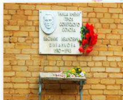
Мемориальная доска на доме №1 на улице Шибанкова В.И. в г. Наро-Фоминске

ВЕЧНАЯ СЛАВА Герою Советского Союза ГВАРДИИ ПОЛКОВНИКУ ШИБАНКОВУ ВАСИЛИЮ ИВАНОВИЧУ И ЕГО ВОЕВЫМ ТОВАРИЩАМ, ГВАРДИЙЦАМ-КАДЕМЬЯМ, ПАВШИМ В БОЯХ ЗА ОСВОЖДЕНИЕ Г. КРАСНОАРМЕЙСКА 6 ФЕВРАЛЯ 1947г.